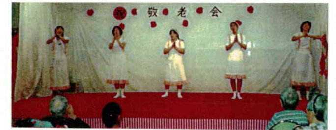
元気の里の乙女がはじけたオハロック。