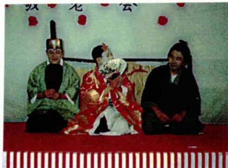
元亀の里版かぐや姫 役者揃いの名場面が次々登場。会場が劇場へと変わったひとときでした。

敬老会当日、開催時刻まじかな苑内には緊張と少しばかりのざわめき。次々と訪れるご家族の皆さん、それぞれの居室から笑顔で会場に向かわれる入所者の方々。各セクションが毎年趣向を凝らしながら楽しさを競う一日は、今年も笑いと涙にあふれた今世紀最後の秋の思い出となりました。