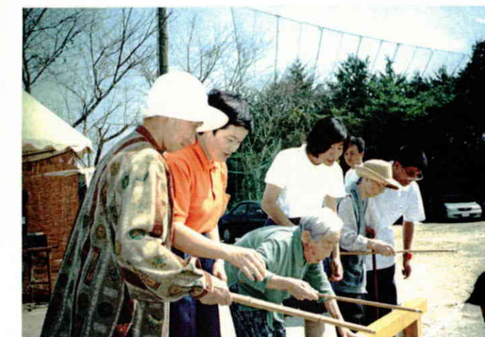
頑張って！！魚釣り競争