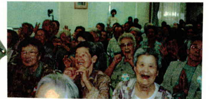
舞台と客席が一体となって楽しんだ一日でした。