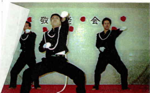
掛け声も凛々しく勇姿をみせた元亀の里応援団。