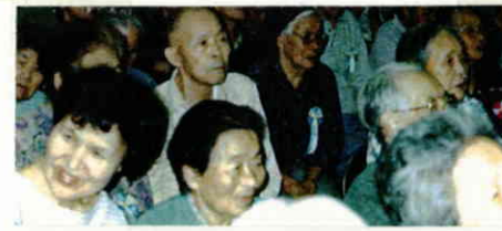
戦時中を思い起こさせた「同期の桜」。その歌と姿に涙がホロリ。