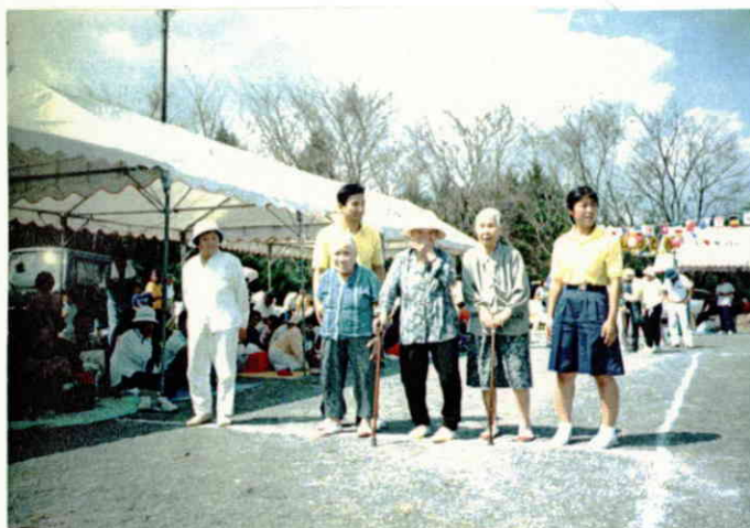
位置についてヨーイ！！

9月23日（土）晴天に恵まれたこの日、中山保育園の招待のもと運動会に参加させていただきました。付き添いの職員は父兄参加の競技に出場、入居者の方々も、小さな子供達の踊りやかけっこに目を細めながら、自らも競技に参加するなど、楽しいひとときをお過ごしになったのではないのでしょうか。