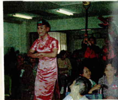
在宅部門が披露した縁起もの蛇踊り。すべてが手作り、製作日数2ヶ月の集大成に会場から「もってこい」の声が何度もかかりました。