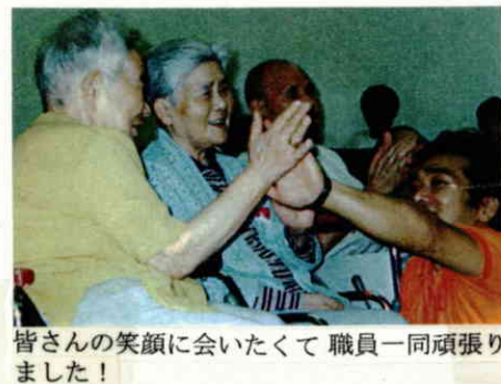
皆さんの笑顔に会いたくて職員一同頑張りました！