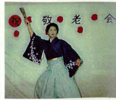
華やかに舞台を飾った舞踊。