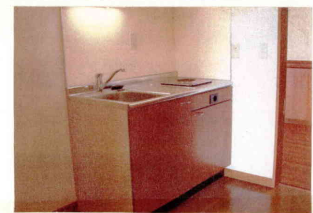
お好きな料理をこのキッチンでどうぞ!!