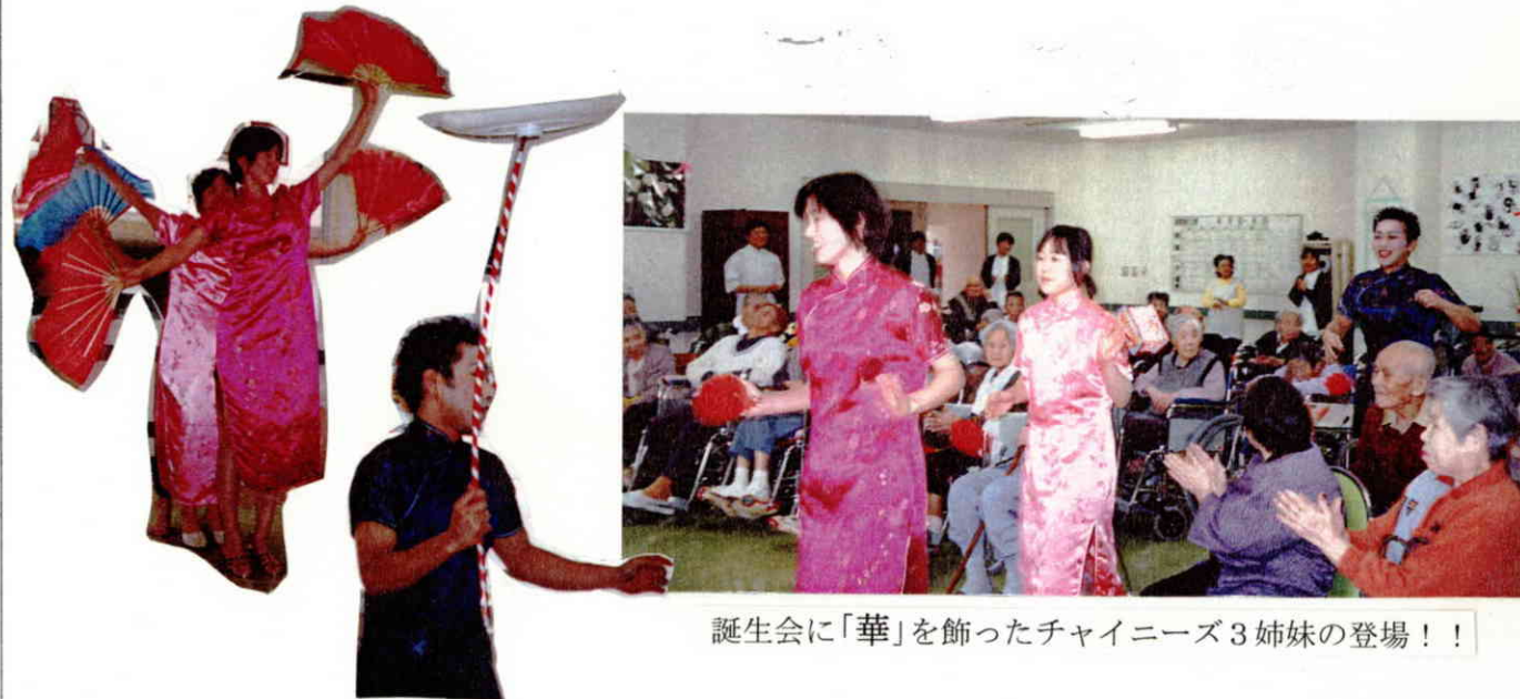
誕生日会に「華」を飾ったチャイニーズ3姉妹の登場！！

2月10日（土）14：00、恒例の誕生日会が開催されました。今回はチャイニーズドレスを着た3姉妹？が登場。重ねに重ねた練習が功を奏し中国雑技団ばりの曲芸をご披露。利用者の皆さんから大きな拍手をいただきました。その後にはプレゼントのひとつとして動物の形をした風船が渡され、「かわいい」との声が聞かれました。