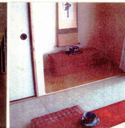
和室にてゆっくりと自分の時間を!!