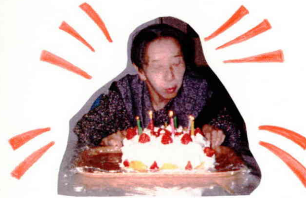
おいしそうなバースデー・ケーキ！！

「ヤッター！出来た！！」そんな掛け声の中みんなで作ったバースデーケーキが出来上がりました。ワンフォアオール・オールフォアワンなんだか暖かい空気が流れていました。