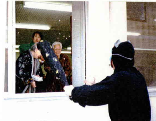
鬼は本当に外へと追い出されてしまいました。