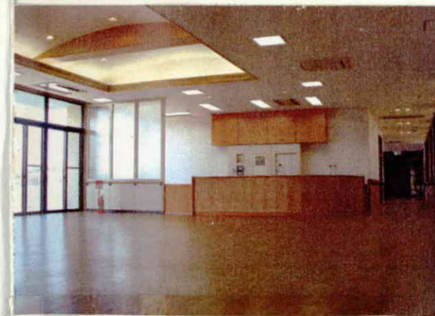
広々としたスペースでゆっくりと!!