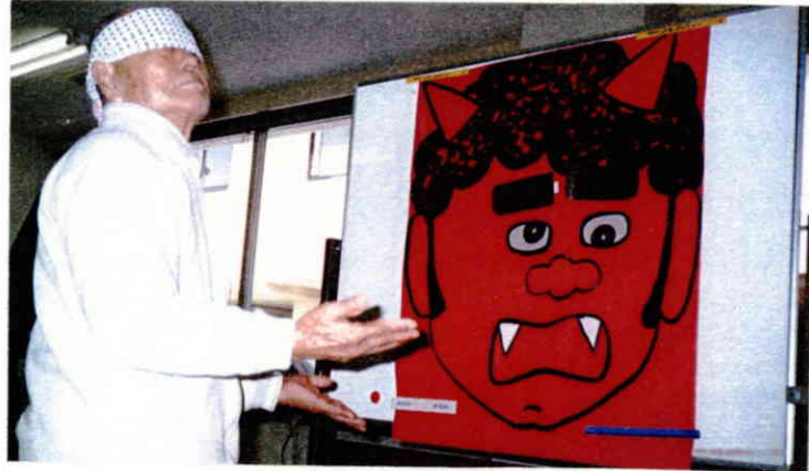
福笑いならぬ福鬼？！

2月3日（土）恒例の豆まきが行われ、今年一年の無病息災を願いました。職員が鬼とあって、入所者の方々も笑い半分、投げつけることをためらいながらも年に一度の豆まきを楽しまれました。今年も無病息災は間違いなし！そんな雰囲気が漂った豆まきでした。