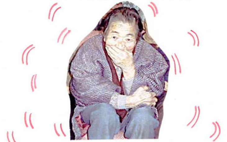
「ハイ・チーズ！」 照れますがな！！

「お誕生日おめでとう」の掛け声と同時に、元気よくろうそくの灯が消されそこには満面の笑みがあふれ、楽しいひとときが展開されていました。