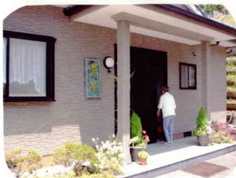
グループホーム翠風の玄関口

皆様に見守られながら、楽しく共同生活を続けています「グループホーム翠風」は、平成13年7月1日より、介護保険サービスである「痴呆対応型共同生活介護」を提供する事業所となりました。定員が9名から8名にと、変更がありましたが、翠風での暮らしはこれまでと変わりません。私たちも、これまでと同様に、共同生活の一員としてお手伝いさせていただきます。今後も、以前と変わらぬご指導を宜しくお願い申し上げます。