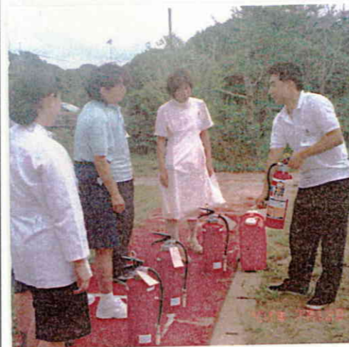
消火器使用方法の説明。

7月12日、せいひ会では年間を通じた消防訓練の1つとして、消火訓練を行いました。今回は、新人職員を中心に館内の消火器設備使用技術の習得を目指した訓練を行いました。職員一丸となって、万が一の事態に備えます。