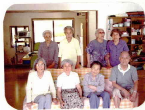
美男！美女！8人衆勢揃い！！