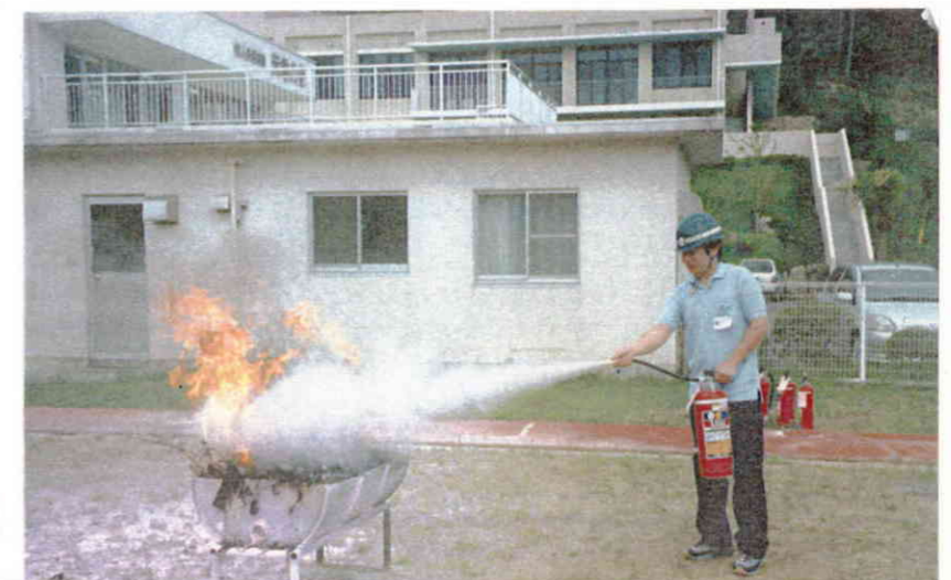
うわっ！思ったより火が消えない！