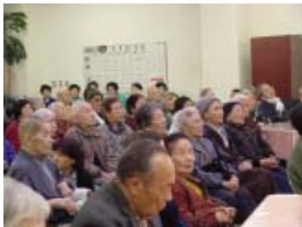
会場も新年気分につままれて