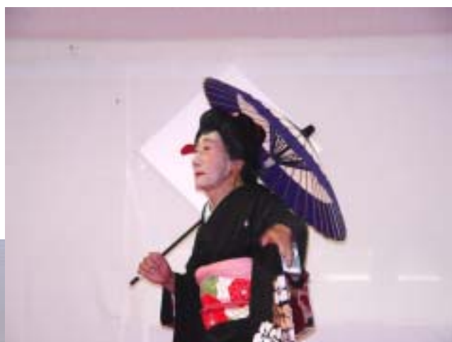
美しい女形にうっとり