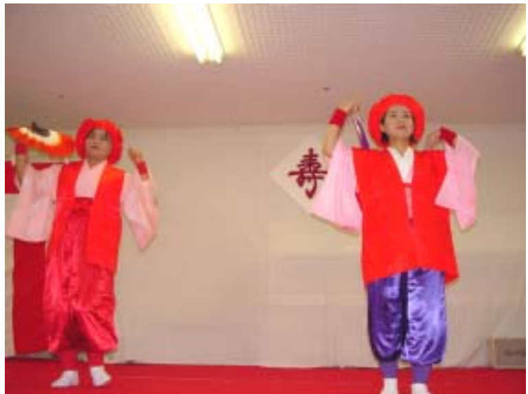
賑々しく華やかに披露された大黒舞