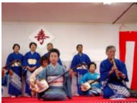
垣山社中の皆さん

新年を迎えられたことに感謝し、気持ちを新たに2002年を元気に過ごしていけるようお願いを託した1日は、あっという間に過ぎていきました。