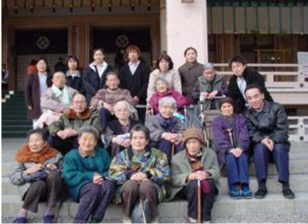
元亀の里・通所利用のみなさま