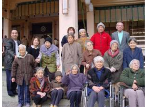
グループホーム・丘の家利用のみなさま