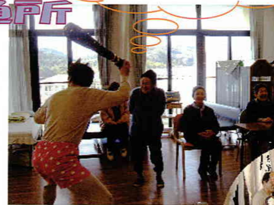
鬼が板についてます。