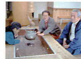
囲炉裏の周りで、 井戸端会議？