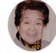
南 ツル様 二月二十六日生