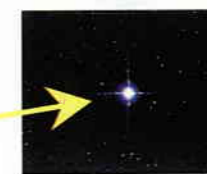
わし座アルタイル (彦星)