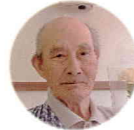
10月10日生 満添二男様