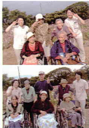
四本堂公園にバスハイクに行きました。ご覧のようにコスモスの花が一面に広がっていました。