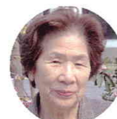
2月23日生 河野ミ工様