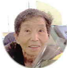
2月7日生 荒木ハツ工様