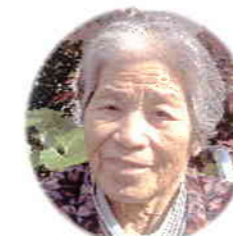
2月22日生 廣瀬フミ工様