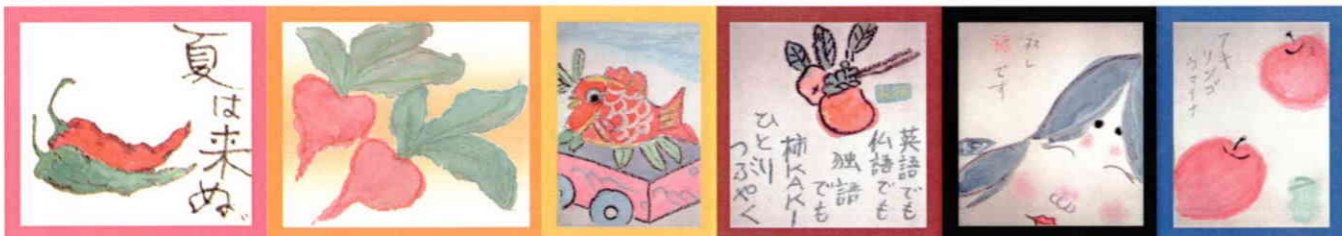
石本チク 村山久代 壇浦リエ 木村ムツ子 山崎トン 太田テル