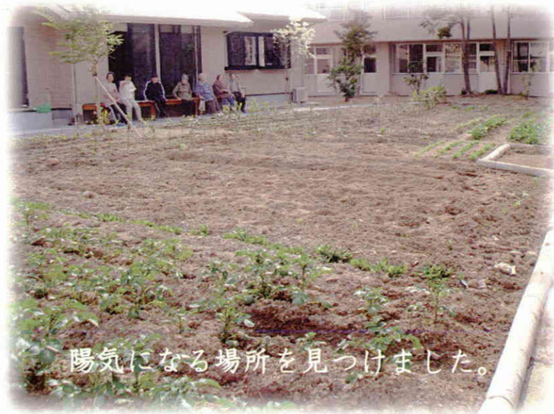
陽気になる場所を見つけました。