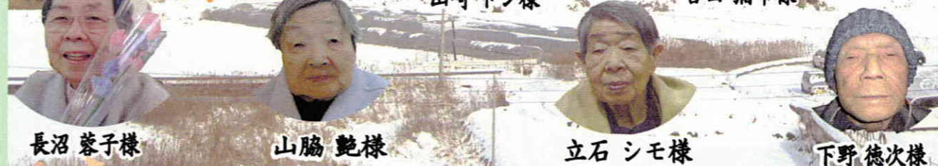
長沼 蓉子様 山脇 艶様 立石 シモ様 下野 徳次様