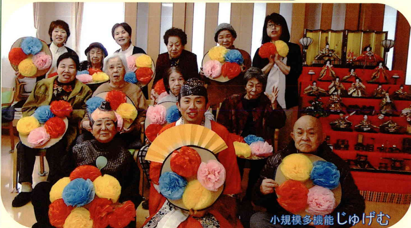
小規模多機能じゅげむ

あかりをつけましょぼんぼりに、お花をあげましょ桃の花！！の歌詞にもある桃の花。元亀の里の庭先にも桃の花が咲きます。例年、梅、桃、桜と順番に咲いていましたが、今年は、桃と桜の花がほとんど同時に咲きました。これも異常気象なのでしょうが？桜の花も咲き始めたかと思ったら、満開になるのがいつもより早い気がします。施設で予定しているお花見。タイミング的に大丈夫かな・・・。春も満開の季節となりました。