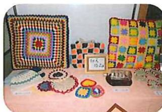
カラフルな編み物作品。皆さんの手先の器用さが表れています。