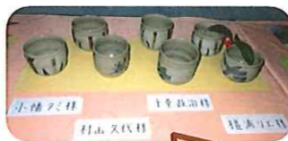
陶芸教室での作品です。