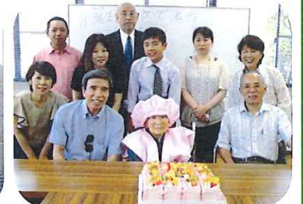
100歳祝いを御家族と一緒に