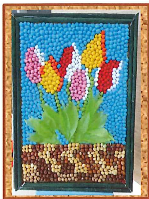
通所ハ利用者作品