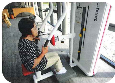
マシン紹介「ローイング」

手や肩、背中に力がついて、食事の際に箸で物を挟んだり、スプーンを口元に運ぶことがスムーズになります。外出の際においては、買い物等で重い物を運びやすくなる等、今まで以上にできることが増えて、生活が楽しくなることが期待できます。