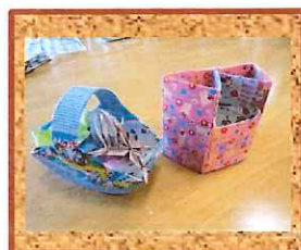
じゅげむ利用者作品