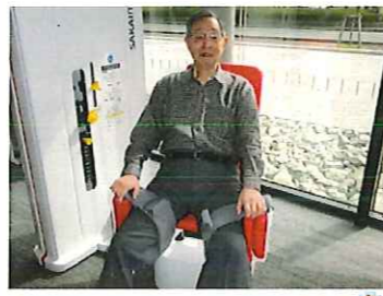
次回 『チェストプレスの巻』

「足を広げる運動はな かなかないので、マ シントレーニングで きてよか〜」「終わっ た後は足が軽くなる」 「太ももの筋肉がつい てきたような気がするよ!」との声が聞かれて いるよ!