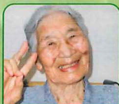
元亀の里 宇都ハリ様