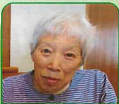
風和の里 作中和子様