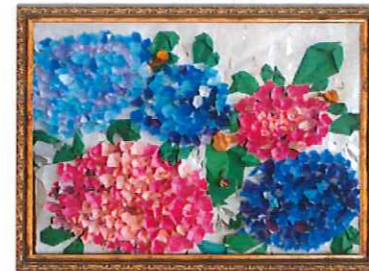
元亀の里共同作品