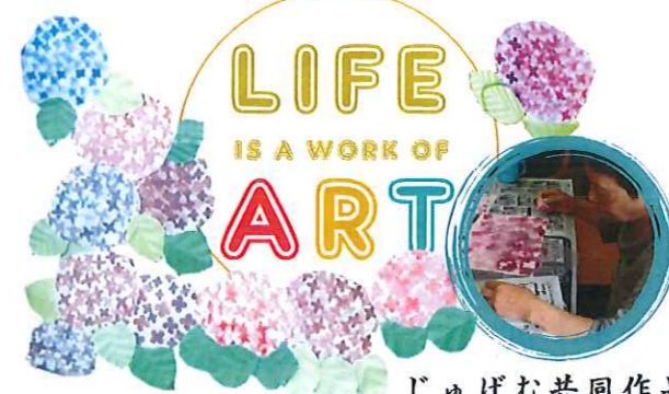
じゅげむ共同作品