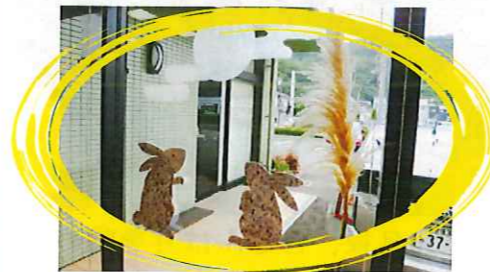
じゅげむ共同作品