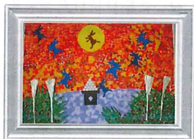
通所介護共同作品