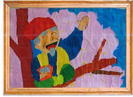
寿限無2階共同作品