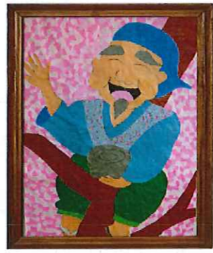
寿限無3階共同作品