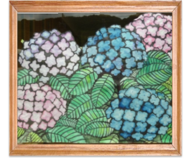
じゅげむ共同作品