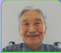
元亀の里 宇都 ハリ様