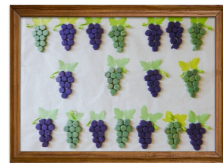
寿限無 酒井様 出口様 山本様 共同作品