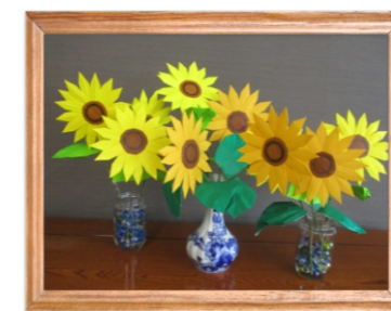
通所リハビリ利用者皆様