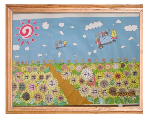
通所介護共同作品