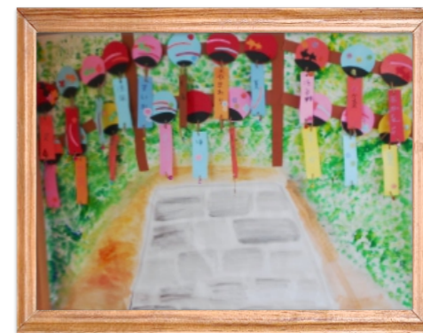
風和の里西ユニット共同作品