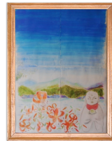
風和の里北ユニット共同作品