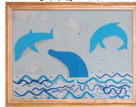
風和の里南ユニット共同作品