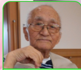
寿限無 富安良雄様