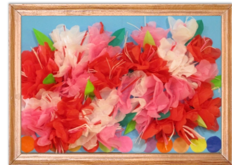
グループホーム共同作品