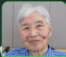
元亀の里 宇都ハリ様