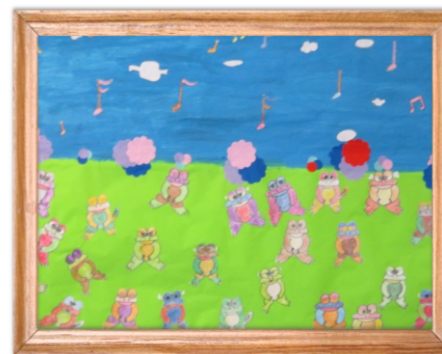
通所介護共同作品