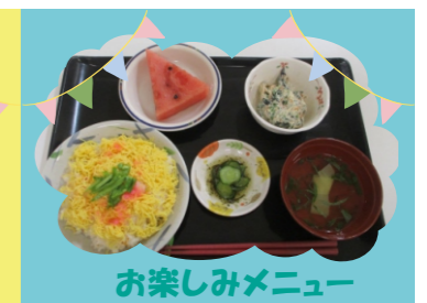
お楽しみメニュー